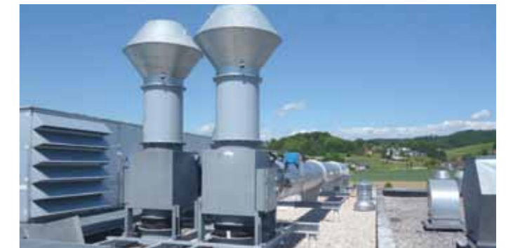
Rohgassystem mit zwei ATEX-zertifizierten Doppelschaltklappen

Wir liefern leistungsstarke Filtersysteme und im Bereich Sicherheitstechnik Standard-MSR-Lösungen bis hin zu umfangreichen UEG-Mess- und Regelsystemen. Dazu kommen Explosionsschutzkonzepte nach den aktuellen, gesetzlichen Richtlinien. Natürlich bieten wir unseren Kunden als kompetenter Systemlieferant auch die nötige Peripherie weiterer Inputgrößen an: unter anderem für Erdgas und Druckluft.